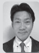
株式会社フォースコミュニティ 講師