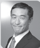
ラーンフォレスト合同会社 代表社員