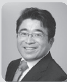
株式会社 ラーンウェル 代表取締役